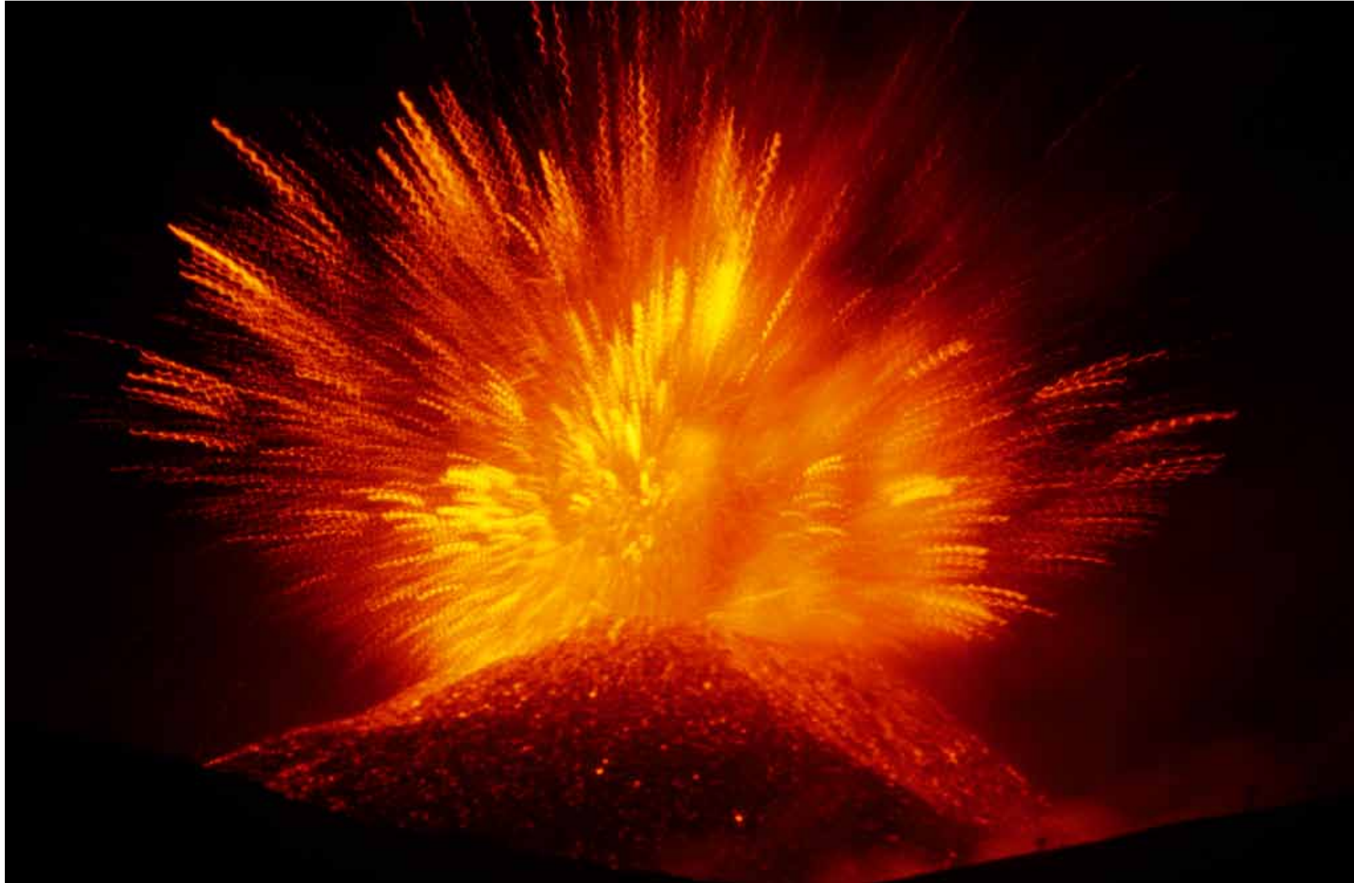
Cus simus vellest iberspe riorrum, corem quibus aut ex exeri utatur?