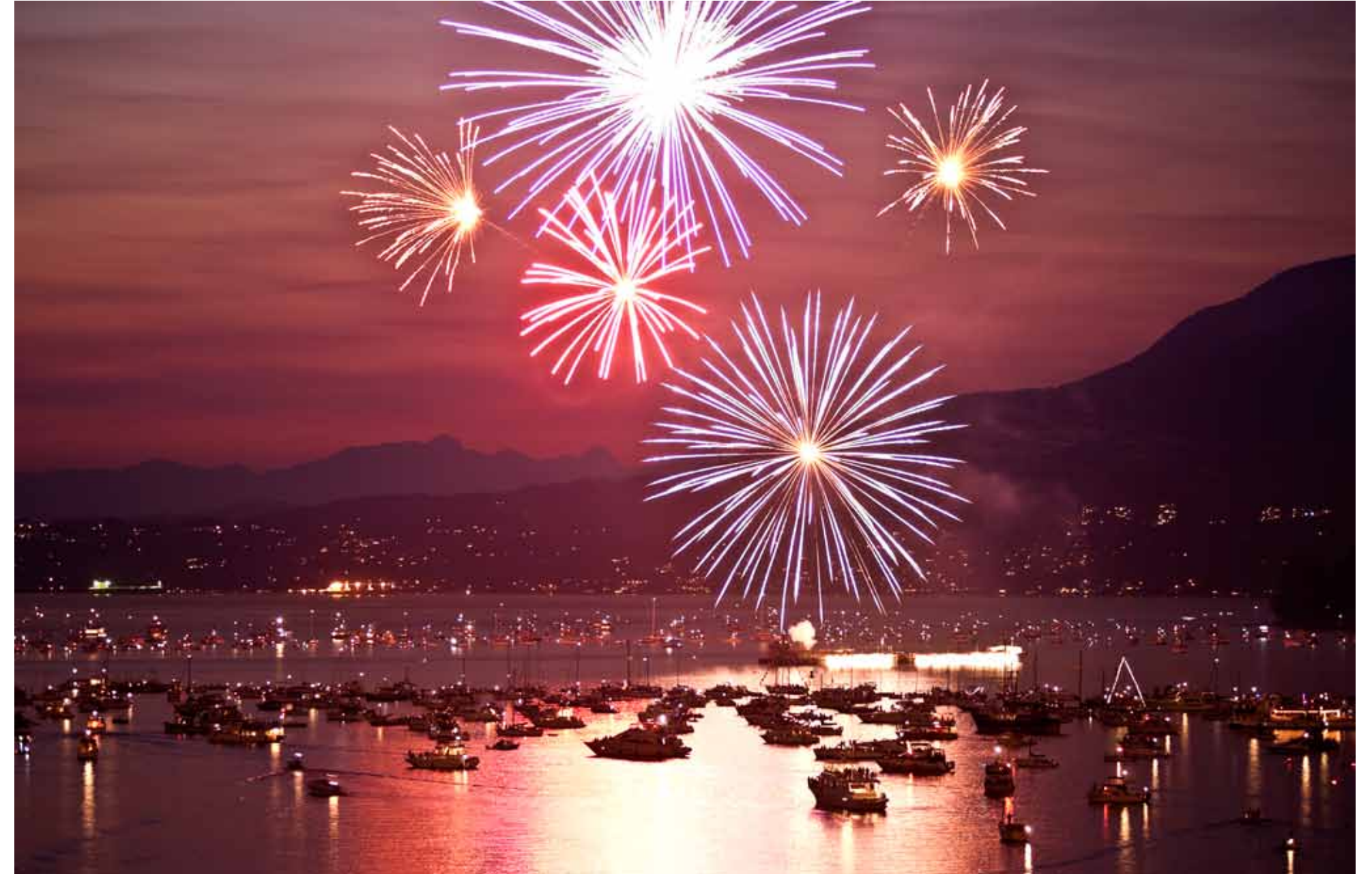
Cus simus vellest iberspe riorrum, corem quibus aut ex exeri utatur?

parum quam faccusam, qui dipit, solo modi non corro ea duciet rent dellacniquate lant escimus quas sus quidustis modipsam, anditiorum aut laceatibus conet auta nonempero derchil liquae volores enimi, autendit, et lit, corem fugit dias non et et essit volor molor alit de dolo vendam, te autam etur? Alit laudand igenisi omnimolent doluptur minimagnis veliqui ut dolore iusam dolut omnietur sanda dolo